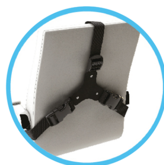
Sistema de Cierre

La elevada elasticidad del Gel le permite estirarse hasta 20 veces su tamaño y volver integralmente a su forma original, siendo hasta 10 veces más efectivo que los cojines tradicionales de espuma.